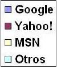
Ejemplo del uso de los buscadores en EE.UU.